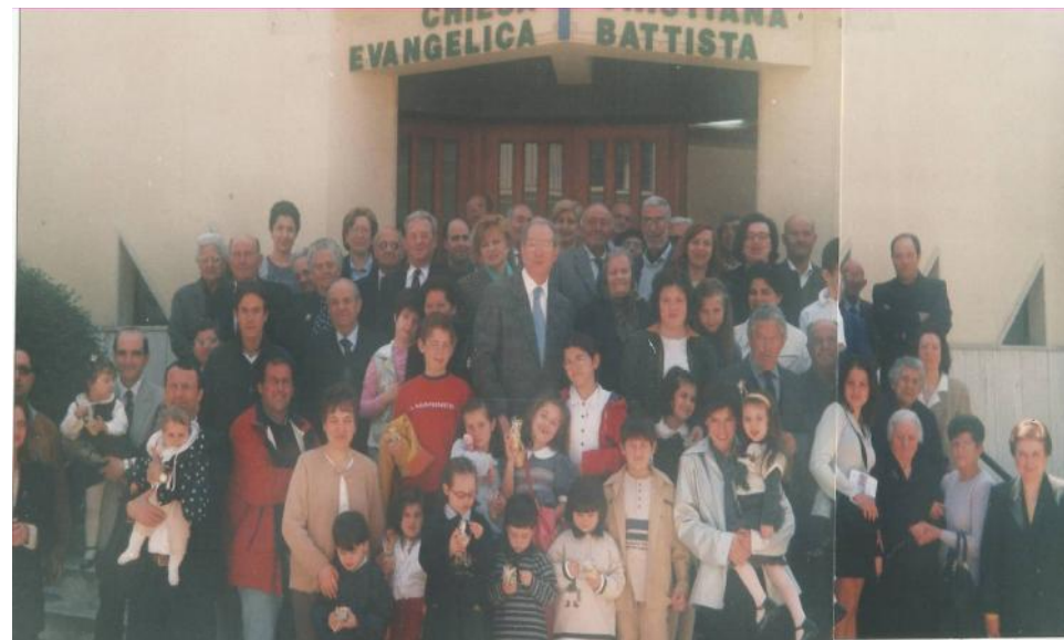
La Comunità di Altamura - Anno 2000 circa